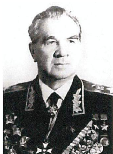
Маршал Советского Союза Чуйков В.И. Начальник гражданской обороны СССР с 1961 г. по 1972 г.

Рост разрушительной силы ракетно-ядерного оружия и неограниченные по дальности возможности его доставки к целям вызвали необходимость создания системы, которая бы обеспечивала надёжную защиту населения и народного хозяйства от оружия массового поражения в масштабе всей страны.